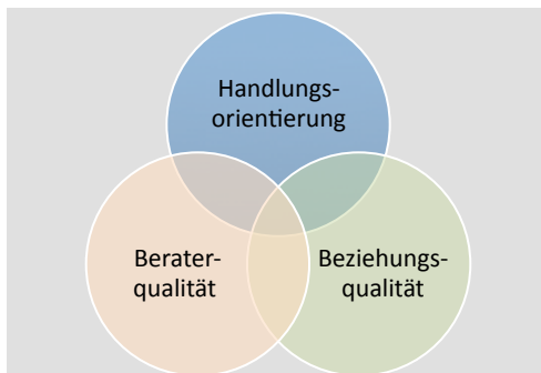
Abb. 1: erfolgreich beraten

Beide Methoden beruhen auf einem vertrauensvollen Arbeitsbündnis zwischen Berater und Klient, das sich in der professionellen Beratung entwickelt. Die Coaching- und Supervisionsforschung besagen: Entscheidend für den Erfolg ist neben der angesprochenen Beziehungsqualität ein Vorgehen, das Ziele konkretisiert, Probleme aktualisiert, Ressourcen aktiviert und Motivationen klärt. Diese Handlungsorientierung gewährleistet ein erfahrener Berater , der sich durch spezifische Ausbildungen, eigene Führungserfahrung sowie langjährige Beraterpraxis auszeichnet.